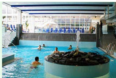
öffentliches Thermal-Felsenbad (50m nebenan)/ public Thermal rock-bath resort (50m near by)